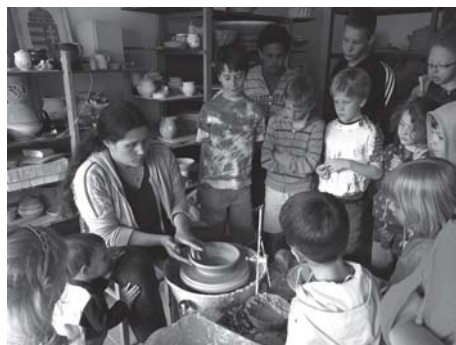
A csákvári gyerektábor résztvevői a fazekasmesterség fortélyáival ismerkedtek.