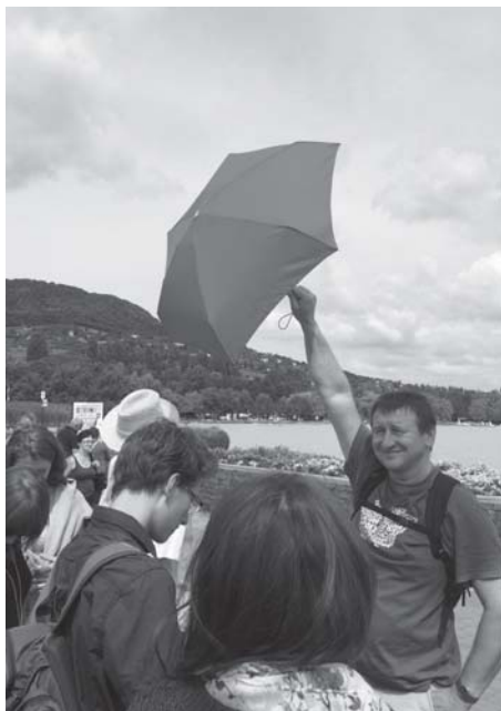
Érkezés a badacsonyi kikötőbe egy kalandos hajóutat követően.