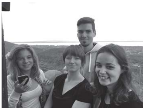
A budapesti és eberni fiatalok kéz a kézben mászták meg a Badacsonyyt.