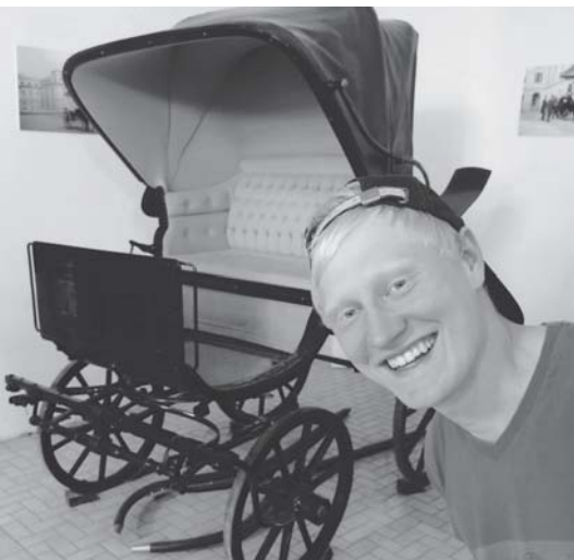
Egy ifjú német kocsis a keszthelyi Festetics kastélyban.