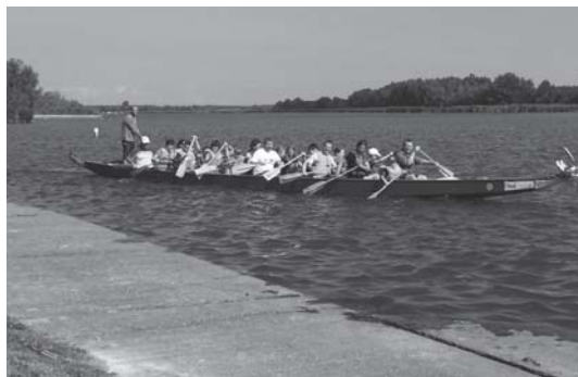
Kicsik és nagyok összehangolt evezőcsapásai repítették a sárkányhajót Domboriban.