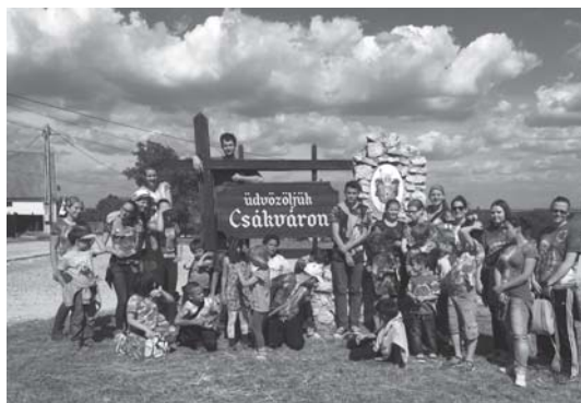
A faluportya minden évben nagy élmény nemcsak a gyerekek, de a vezetők számára is.