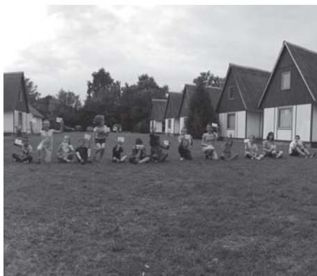
A közös játék nagy élményt jelentett a családok számára táborhelyünk udvarán.