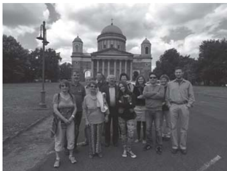
Eberni bartátainkkal Esztergomba is ellátogattunk egy kirándulás erejéig.