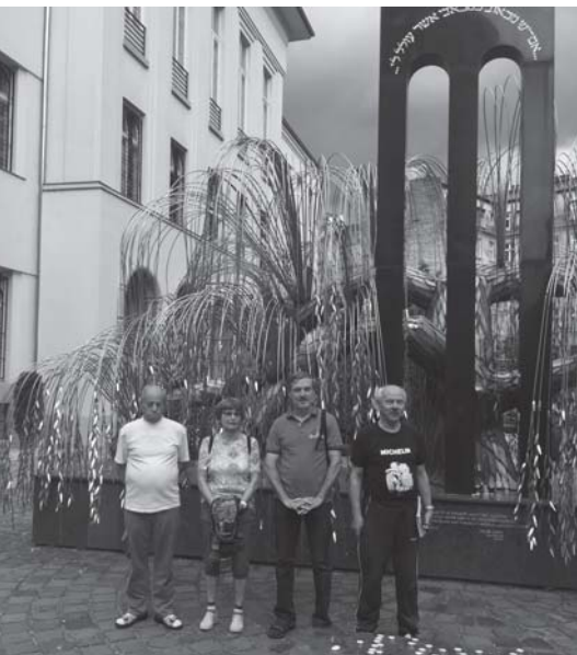
A júniusban Budapestre látogató eberni testvéreinkkel a zsinagógában is jártunk.